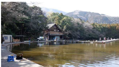
ログハウスと第1ポンド