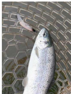
イーグルプレーヤー40slimGJ オレダクション