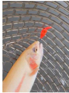
モカDR(SS) オラオラオレンジ