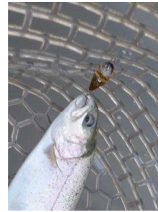
ポップンバグ グリーンパンプキン