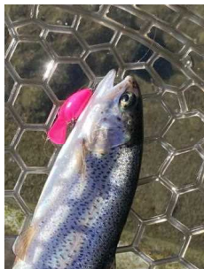
ちびパニクラDR-SS 蛍光ピンク