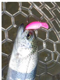
ちびパニクラDR-SS 蛍光ピンク