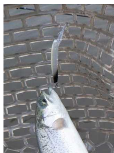
イーグルプレーヤー50slimGJ ゴールドアーク