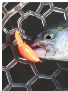
ちびパニクラDR-SS 蛍光オレンジ