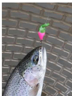
ファットモカJr. SR(SS) ミドピーノ風