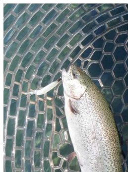
イーグルプレーヤー50slimGJ ゴールドアーク