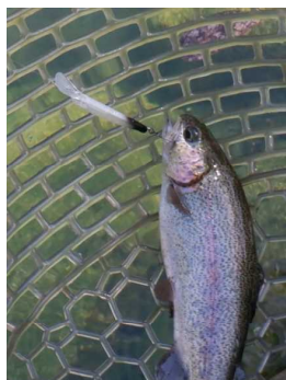
イーグルプレーヤー50slimGJ ゴールドアーク