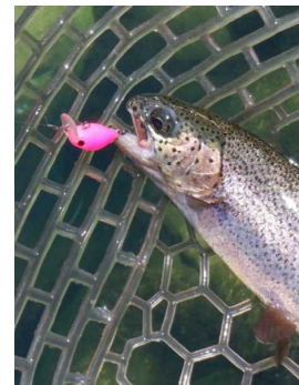
ファットモカJr. SR(SS) 蛍光ピンク