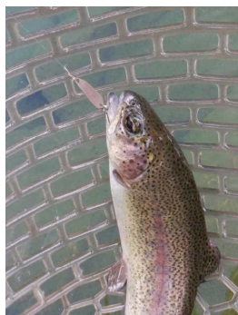
ジギルjr 0.7g ミルクココア