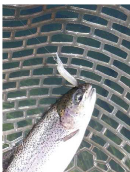
イーグルプレーヤー ゴールドアーク