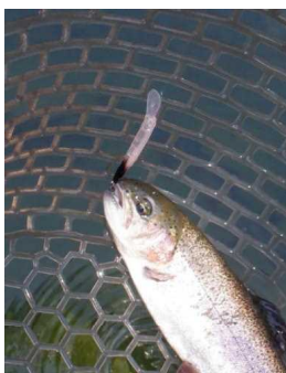
イーグルプレーヤー オレダクシオン