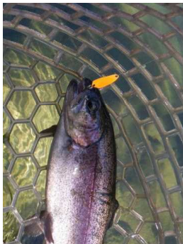
ジギルjr 0.7g 蛍光オレンジ