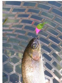
ちびパニクラDR-SS ミドピーノ風