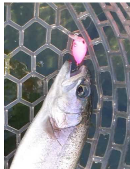
ファットモカJr. SR(SS) 蛍光ピンク