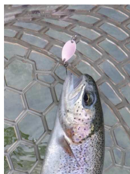
ベッキー 0.6g 雪ウサギ