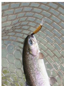
グリム51HF MJ サンクオリカラ