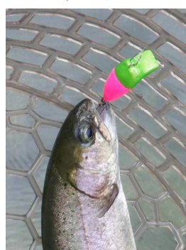
自作クランク(SS) ミドピーノ風