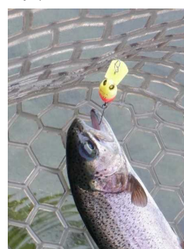
プチモカSR(F II) 黄・オレンジ