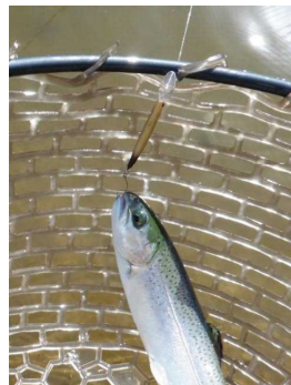
グリム51HF MJ サンクオリカラ