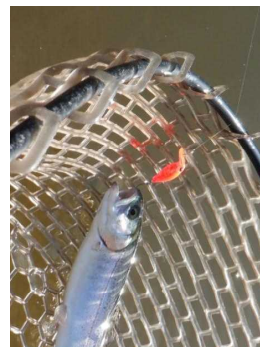
モカSR(SS) オラオラオレンジ