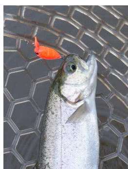
プチモカSR(SS) オラオラオレンジ