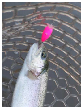
モカ ラトル SR(SS) 蛍光ピンク