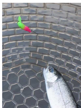
ミニグラスホッパー SP ミドピーノ