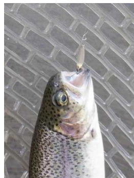
チェイサー 0.6g マロン