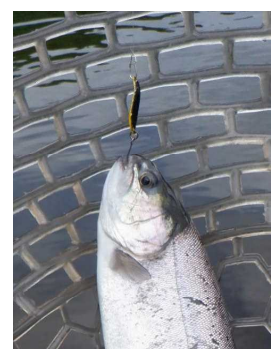
ファクター0.9g セカンドイエロー