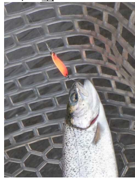
マーシャルトーナメント1.5g オレ金