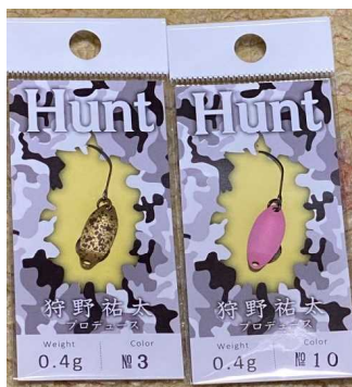
ゴブリン ピクオリ

マーシャルトーナメント1.5gオレ金を“少し速めに4～5回巻き、一瞬の止めを入れる”を繰り返す。止めたときに当たってくる。