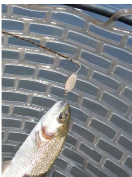
ファクター0.9g マロン