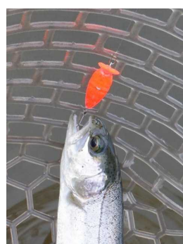
モカSR(SS) オラオラオレンジ