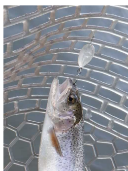
マメしずくレジン 半透明