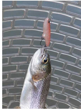
ダートラン ショボクレレッドグロー