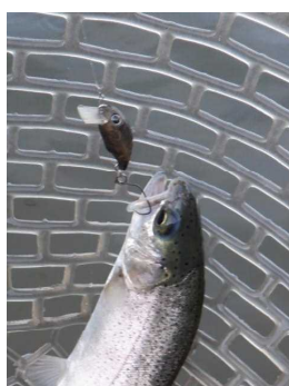
マイクロクラッピーSR 茶系