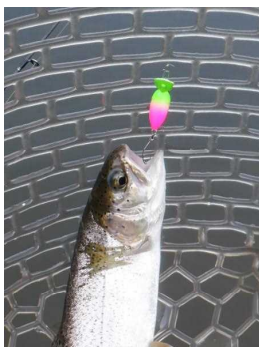
プチモカ ミドピーノ