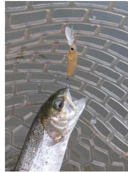
スティル イルペレジャーク