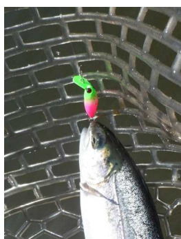
プチモカSR(SS) ミドピーノ