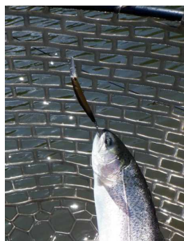
グリム51HFMJ サンクオリカラ