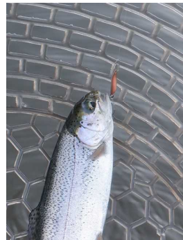
M2 0.8g サンクオリカラ