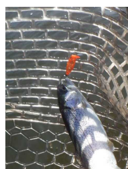
ウッサS オラオラオレンジ