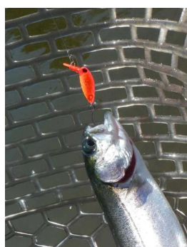
プチモカSR(SS) オラオラオレンジ