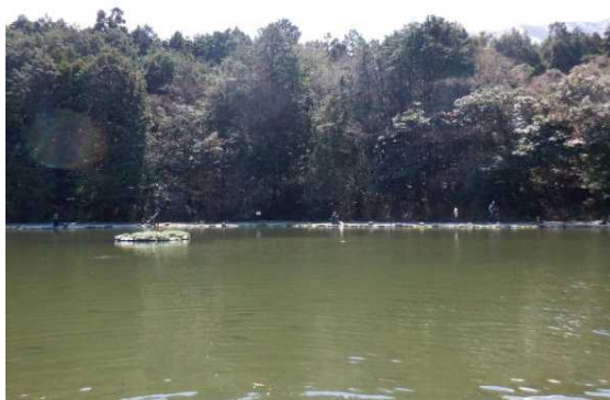
南向きでまぶしい