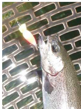
プチモカSR(SS) 黄・オレンジ