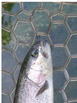
チェイサー 0.6g マロン