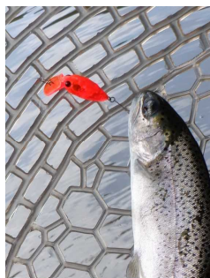
オラオラオレンジ